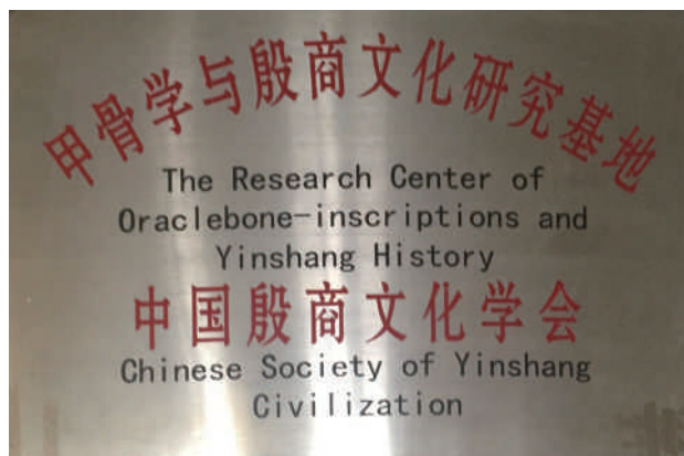
甲骨学与殷商文化研究基地