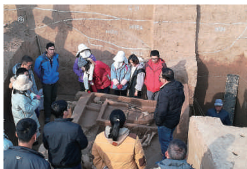
考古专业学生进行专业考察