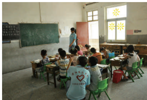
暑期支教志愿服务